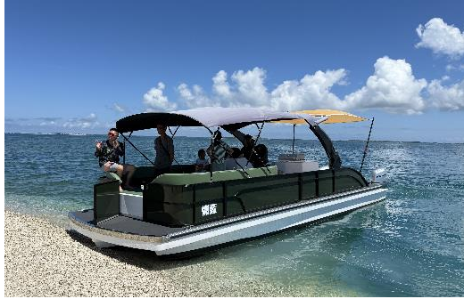
圖三、便捷的澎湖跳島新利器-慵藍號