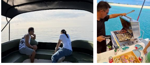
圖二、慵懶地在慵藍號享受慵懶