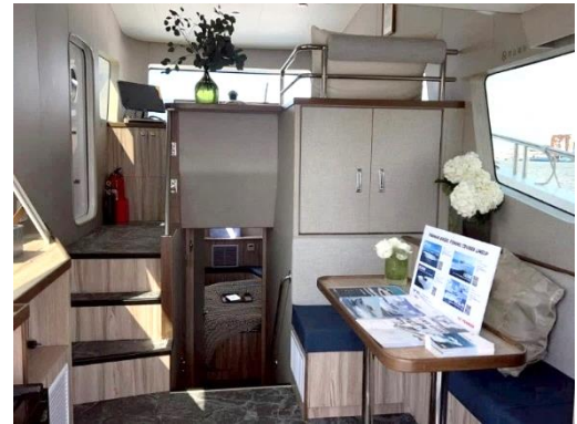
圖五、錯層甲板梯間

現公私領域的明確分界，在視野開闊的升高式駕駛台下方，規劃出寬裕且具高度私密性的主人房；而飛橋駕駛台 (Flybridge) 的設置，則為船主提供更優越的操駕視野與獨立的戶外休憩場域，使本船即便於緊湊的噸位條件下，仍展現出豪華遊艇所應具備的從容氣度。