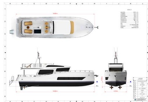
圖一、中港號一般佈置圖

於航行性能方面，本船採用垂直艙結合寬船體之船型設計，兼顧破浪效率與航行穩定性，並配置國內同級船型中罕見之陀螺儀穩定系統，使船舶無論於巡航航行或靜態錨泊狀態下，皆能有效抑制橫搖，維持卓越的穩定表現，實現動靜皆宜、舒適從容的海上休憩體驗。