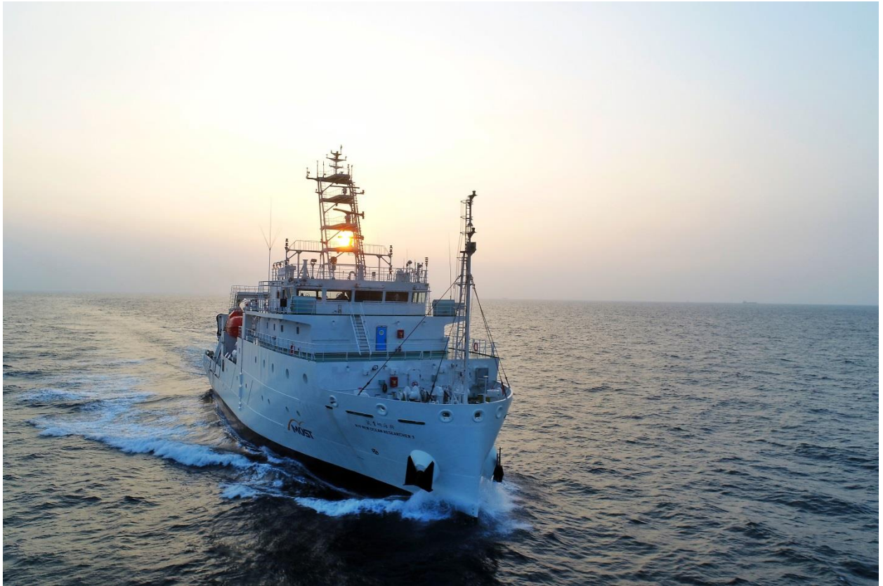
圖 1 『新海研 1 號』海試英姿