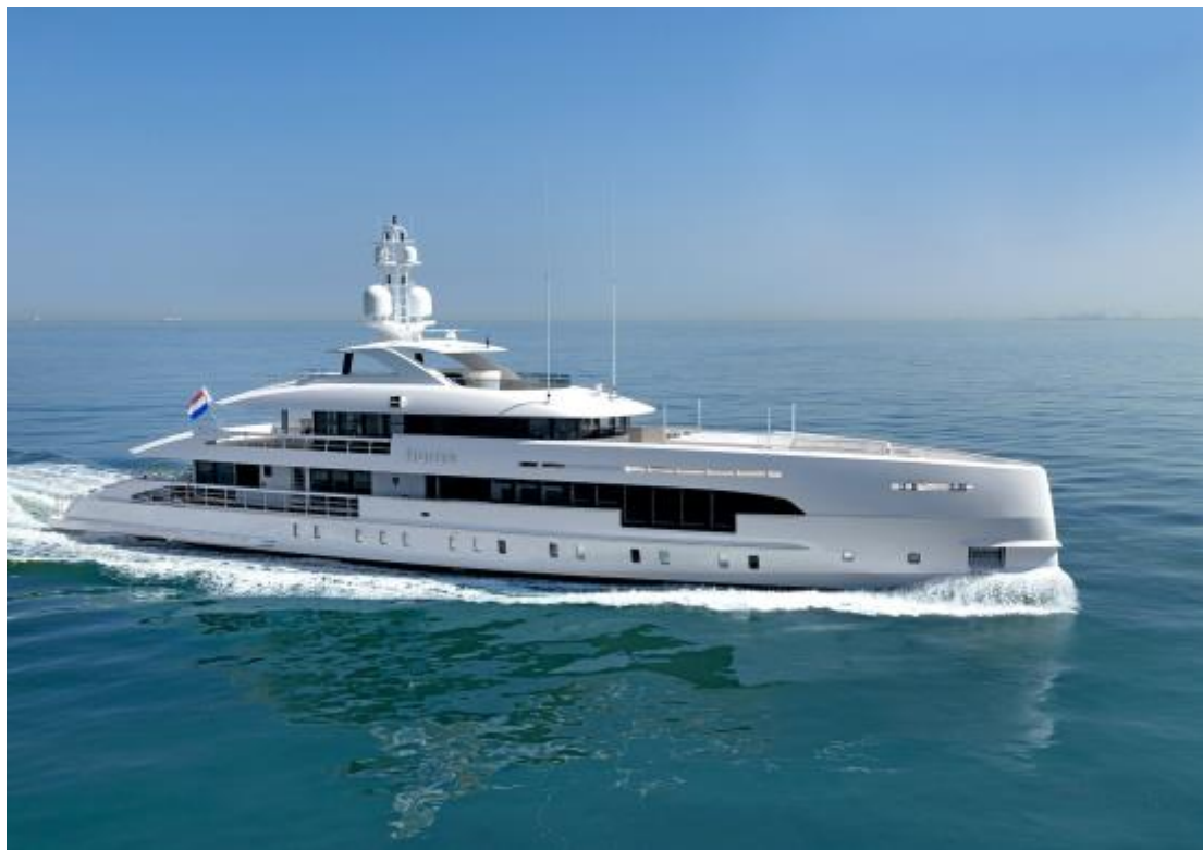
Heesen Yachts 造船廠 Nova Hybrid 船

荷蘭造船廠 Heesen Yachts 的「Nova Hybrid」專案為客戶打造 50 公尺長快速巡航遊艇，採用的動力是 1,200 千瓦 (2 x MTU 12V 2000 M61) 柴油引擎搭配 2 x 110 千瓦的電動馬達。全鋁打造的遊艇僅採用電力航行時，可極其寧靜的達到 9 節的航速。