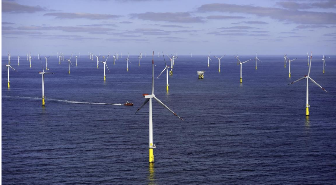
圖 2 Gode Wind 1 與 Gode Wind 2 離岸風場