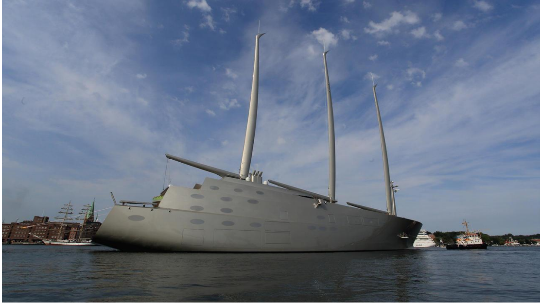
圖 2 SAILING YACHT A