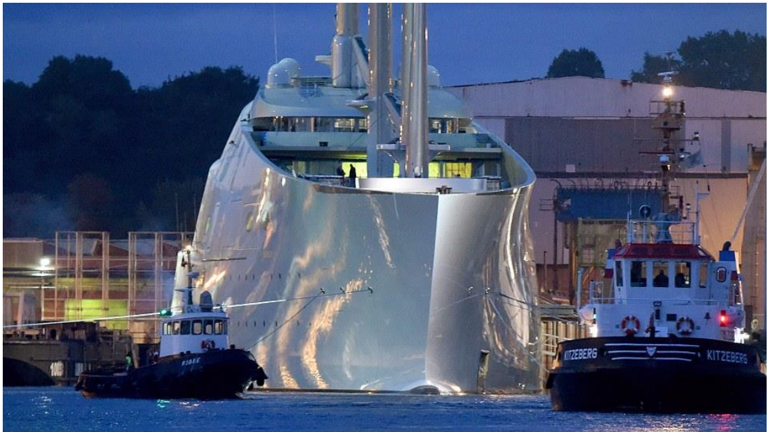
圖 3 SAILING YACHT A