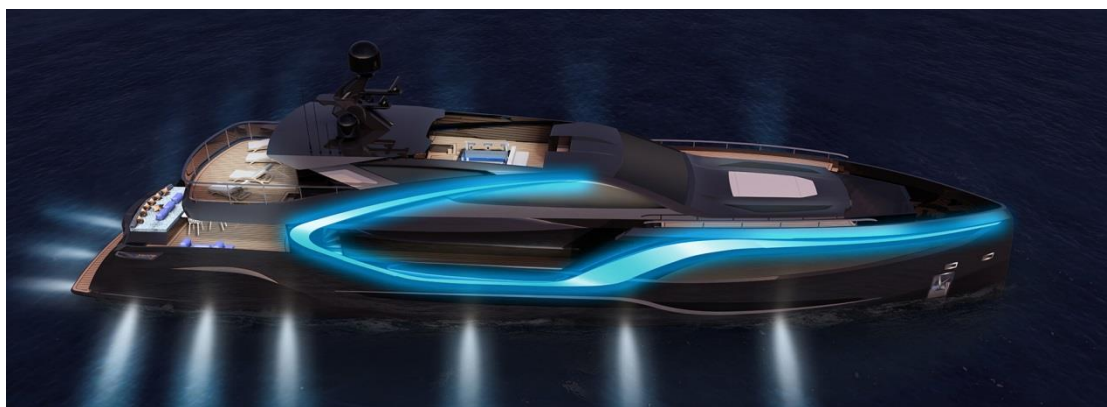
圖 1 42 公尺的頂級遊艇