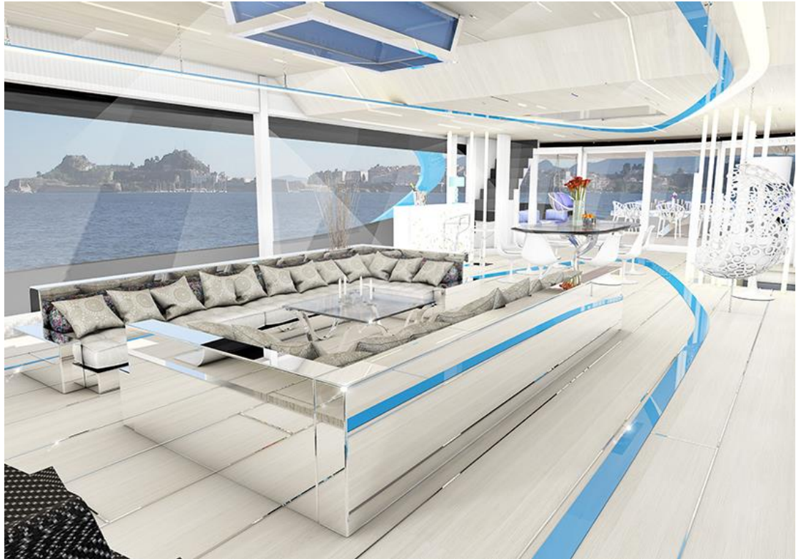
圖 2 I-TRON 的內裝充滿無數反光表面

「I-TRON」的內裝設計將未來感元素及燈光融合為一。設計師 Treleani 運用特意的反光曲面邊緣、發光材質和表面以及天花板與艙壁的巧妙開口，營造出充滿未來感、明亮的船艇內空間，並白與藍搭配的色調，正呼應遊艇外觀曲線的細部設計。主臥船艙位於遊艇前方，擁有私密的玻璃走道及陽台，讓人可同時享有周遭內裝與外觀的景觀。值得一提的是「I-TRON」專案的海灘俱樂部設有採用玻璃底材的夢幻型私人游泳池，最能提供絕美的水下風光。