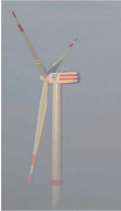
圖 2 Senvion 風力機(型號 6.2M-126)