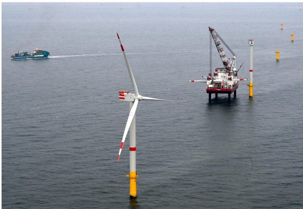
圖 4 Nordsee One 首座風力機於 2017 年 3 月完成安裝

http://www.offshorewindindustry.com/news